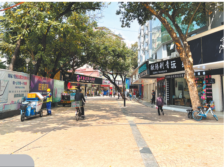
香洲迎宾路毗邻拱北口岸,昔日熙熙攘攘的这里如今显得安静