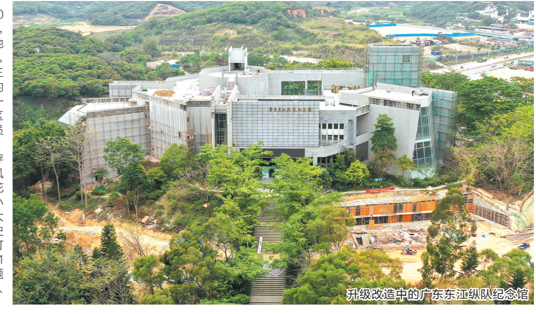
升级改造中的广东东江纵队纪念馆

依托大岭山抗日根据地旧址，东莞市于2005年9月在纪念中国人民抗日战争暨世界反法西斯战争胜利60周年之际，在大岭山镇大王岭村建成了广东东江纵队纪念馆，力求将纪念馆打造为东莞抗日的写真地、全国爱国主义教育的重要基地和世界反法西斯战争的见证地。4月7日，记者走访发现，广东东江纵队纪念馆正在进行紧张的施工改造。据悉，东江纵队纪念馆内一共有三套基本陈列展览，包括东江纵队历史图片展览、《东江纵队 南粤旗帜》以及国防展馆的主题展览、大岭山抗日根据地旧址的陈列展览，展览通过大量的历史图片、文物、武器装备等，客观、全面地反映了抗日战争时期，中国共产党领导的广东人民抗日游击队东江纵队，为了民族的解放事业浴血奋战、夺取胜利的光辉历程。“今年是中国共产党成立100周年，纪念馆进行全面升级改造，今年7月份将以崭新的面目迎接各方游客，全新升级的《东江纵队 南粤旗帜》主题陈列也将向社会开放，同