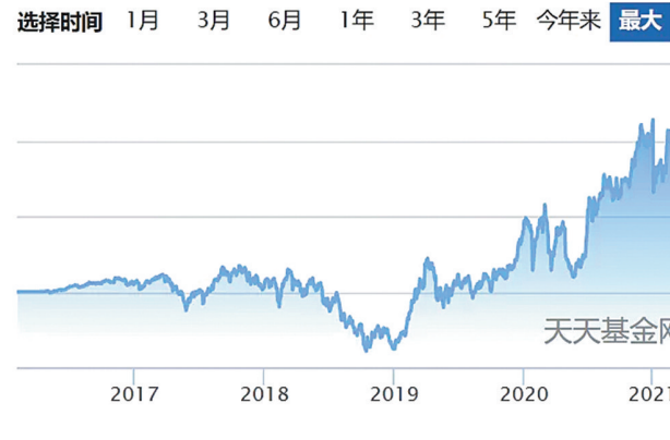
九泰锐富事件驱动混合近几年净值走势图

作为资本市场不可或缺的一股力量,“牛散”动向历来被投资者津津乐道。那么,他们买基的眼光怎样?据《上海证券报》报道,数据显示,若以权益类基金第一大持有人数据为样本来看,假设截至4月9日他们仍然等量持有去年末份额的基金,最高单只基金亏损额可超6000万元,盈利最多的有1267万元,若仅看短期,这些牛散亏损人数多于盈利人数,且业绩分化明显,跟风抄作业的危险不小。但拉长眼光来看,盈利还是颇为丰厚的。