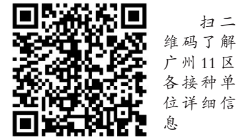
扫二维码了解广州11区各接种单位详细信息

接种人士预约成功后,可在指定时间、地点,携带中华人民共和国外国人永久居留身份证或护照及有效居留证件、医保参保凭证前往。在指定接种点接种前,按程序签署知情同意书、免责声明书等,做好个人防护并主动告知健康状况,由专业人员判定是否符合接种条件。接种14天内请密切关注自身身体情况,如有不适,请及时就医。