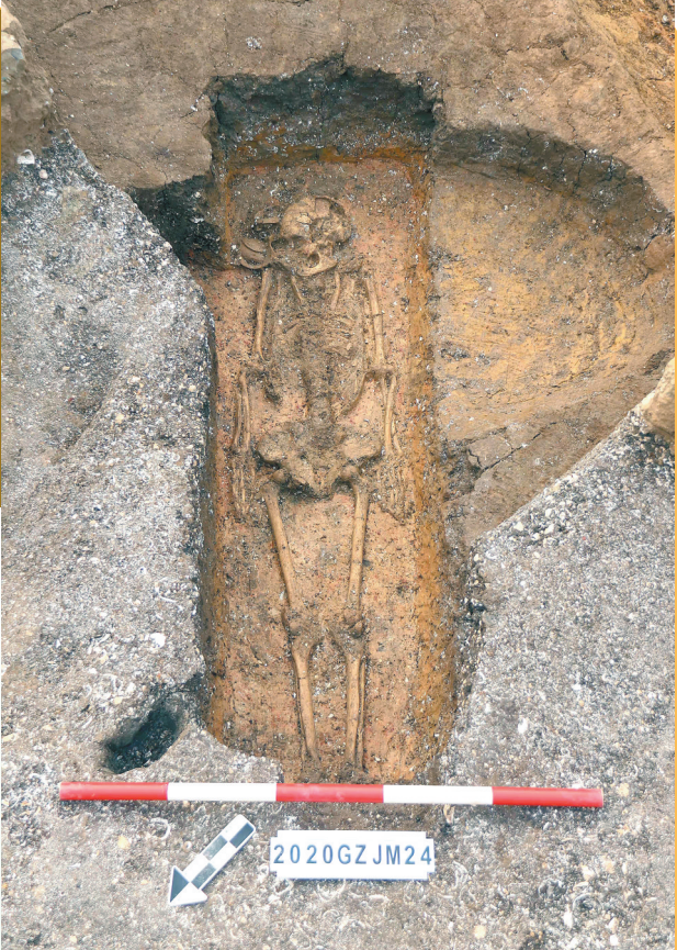
金兰寺遗址墓葬中的仰身直肢葬

“金兰寺遗址本次发掘,为我们提供了两种葬俗,完全不同的古人在此生活的宝贵资料。该遗址出土的人骨材料,未来可能通过