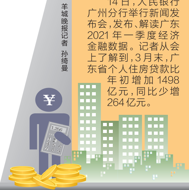
羊城晚报记者 孙绮曼

14日,人民银行广州分行举行新闻发布会,发布、解读广东2021年一季度经济金融数据。记者从会上了解到,3月末,广东省个人住房贷款比年初增加1498亿元,同比少增264亿元。