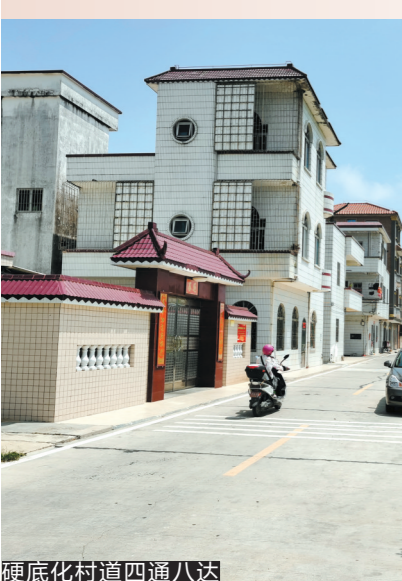
硬底化村道四通八达

春光明媚,羊城晚报记者日前重访昔日贫困之村——湛江吴川市黄坡镇稳村,只见一条条硬底化道路,四通八达,直通到每户村民的家;一栋栋村民的小洋楼,鳞次栉比……稳村的巨变,令人切身感受到脱贫攻坚给农村带来的翻天覆地变化。