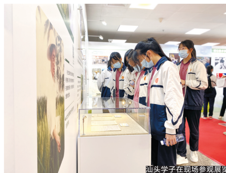
汕头学子在现场参观展览

香港高校毕业生来深创业人数亦增幅迅猛。今年一季度申请深圳各类创业补贴的港澳高校毕业生136人,分别是2019年和2020年全年的3倍和1.4倍。深圳市各类创新创业载体累计孵化香港团队上万个,预计正常通关后还会有显著增加。下一步,深圳市将为来深就业创业的港澳高校毕业生搭建一站式服务平台,拓展港澳青年就业空间。