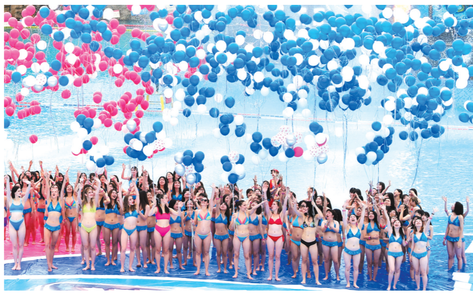
五一假期即将到来，号称“最火五一出游高峰”已蠢蠢欲动。对广东省内不少景区来说，提早入夏的季节优势成为揽客的一张王牌。17日为周六，清远佛冈温泉乐园水世界、广州长隆水上乐园等不约而同选择在这一天开门迎客。