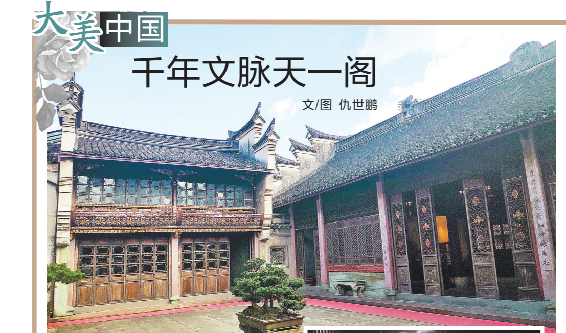
大美中国 千年文脉天一阁

空气，连玩带走，仿佛登山春游。她说，春天进山，在山道上常会遇到腰别竹篓的采茶女工。她们也基本上是各村的奶奶辈了，相约出来采茶，见到山里一棵两棵的梅花桃花，依旧会像小女孩一样，闹闹嚷嚷、喜气洋洋地蹲下一小枝，插在发髻上。采茶与挖笋一样，其实也是贴补家用的一种有趣活动，可以让婆婆妈妈们暂时从劳碌的家务事中摆脱出来，把接孙子、烧晚饭、喂鸡鸭的任务交付一天给老伴在村头打牌下棋的老头子，出来舒展一下腰身，过几日少女时代般自由自在的生活。挖完一片竹园的笋，找竹园主人结算完工钱，竹园主人通常会将创新了根根长至了或过于短小的笋送一些给祁妈妈，说：“别嫌弃，回去搞一锅笋腌笃鲜，能解馋解乏。”祁妈妈告诉我，这两年，她在这个农民活动中心学习写春联、编中国结、扎制元宵灯笼、做蜡染布包、剪纸、编织蒲鞋，还学得许多与乡村生活完全无关的事：写诗、吹笛子、制作茶叶标本、拍摄与剪辑小视频，还用山间的野花、野果插花。祁妈妈的儿子在山中开了一间民宿，祁妈妈出品的许多烂漫纯真的习作，都被儿子用来装饰了民宿的客房和餐厅。