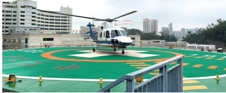
直升机抵达中山五院停机坪

羊城晚报 讯 记者唐珩、通讯员南宣摄影报道:7时30分左右,携带肺源的医生抵达南宁吴圩机场;7时45分,医生登机;8时9分,飞机起飞,签派员向空管申请航班直飞深圳;9时7分,CZ3273航班飞抵深圳;9时23分,直升机起飞前往珠海;9时47分,直升机到达中山大学附属第五医院。4月17日,一场生命接力在空中上演。病人急需移植的肺源跨越三省(区)三市,首先由南航CZ3273航班从广西南宁运抵深圳,再由南航通航直升机接驳转运至珠海中山五院。从医生登机到肺源抵达中山五院,全程仅用时122分钟。16日,南航接到运输任务,珠海一名病人情况危急,急需进行肺移植挽救生命,但南宁-珠海两地间没有时间合适的航班。南航最终制定了医生携带肺源搭乘CZ3273航班先抵达深圳、再在深圳搭乘南航直升机中珠珠海的方案。时间就是生命!想要提升移植手术的成功率,就需要尽可能地缩短肺源运输时间。为此,南航深圳分公司紧急召集各空、地保障部门开展会议,梳理保障流程、制订应急预案,并向空管、机场等单位进行了信息通报,请求予以协助。“接到此项紧急任务后,我们当天晚上9时专门召开布置会议,从飞行路线、停机位和保障流程,制订应急预案,并向空管、机场等单位进行了信息通报,请求予以协助。”“接到此项紧急任务后,我们当天晚上9时专门召开布置会议,从飞行路线、停机位和保障流程,制订应急预案,并向空管、机场等单位进行了信息通报,请求予以协助。”