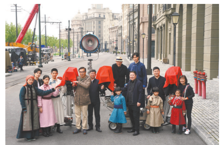
《海的尽头是草原》主创团队合影