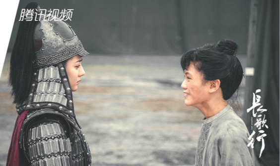
与阿隼(右)告别一幕让迪丽热巴印象深刻