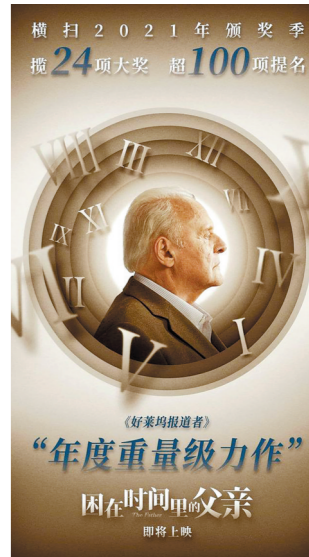
横扫2021年颁奖季 揽24项大奖 超100项提名

“记忆迷宫”预告片则展现了一位迟暮老人记忆衰退的日常。父亲安东尼身陷残酷又混乱的记忆困局,他一方面对古怪的病症毫无办法,另一方面还要时时提防亲人夺走自己的财产。电影聚焦亲情,透过患病老人的视角感受困惑与眩晕,给人前所未有的感官式观影体验,直击内心。(邵梓恒)