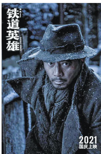
张涵予演绎铁道英雄