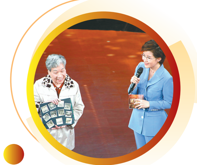
一名东深供水工程建设者代表在“时代楷模”发布仪式上展示工程建设者的老照片

半个多世纪后的今天，世界面临百年未有之大变局，中华民族的复兴正砥砺前行。作为国家重要战略部署，粤港澳大湾区建设也面临“一个国家、两种制度、三个关税区”等重大挑战。使命光荣而艰巨，更需要新时代的建设者继承和发扬老一辈建设者的精神，以实际行动为推进粤港澳大湾区建设贡献力量。（新华社）