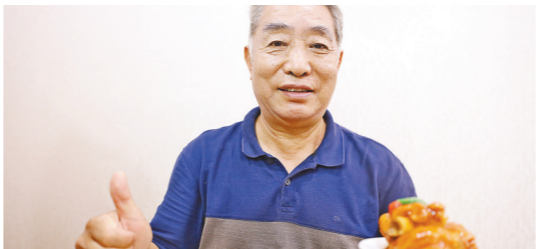
种牙后的黄先生生活质量提高，点赞称好！