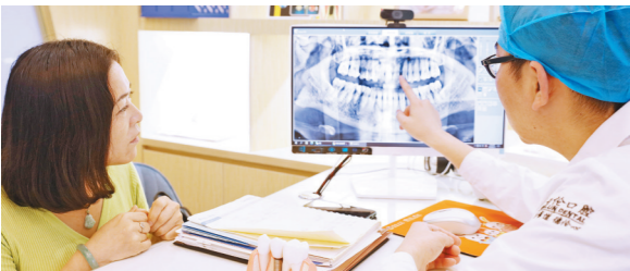
博硕专家一对一亲诊

“广东爱牙工程社区行”福利进行中，即日起致电 020-8375 2288 申领高额种牙补贴，享博硕学位种植名医亲诊，免挂号费、专家会诊费！