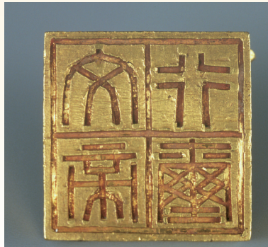
“文帝行玺”龙钮金印——印文

1983年发现的广州南越王墓是目前所知岭南地区规模最大、保存最完好、随葬品最丰富的汉代墓葬,墓主人为2000多年前南越国的第二代君主赵昧。