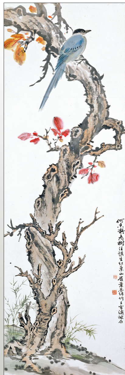
何香凝 汪慎生 叶恭綽 王雪涛《枫·鸟》