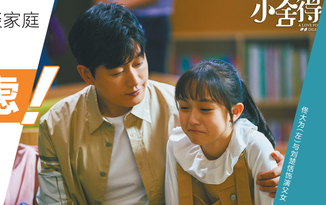
佟大为(左)与刘楚恬饰演父女