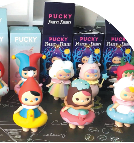
泡泡玛特已成为全球风靡的盲盒品牌 (资料图片)

无意间压到作为赏罚事件触发物的控制杆时，他就给予老鼠食物奖励。一段时间后，老鼠就会有意地按压控制杆，以获得食物。然后他逐渐改变老鼠要获得食物所必须按压控制杆的次数，他发现，如果他停止给老鼠食物，老鼠逐渐不去压杆，即使听见喂食管有响动也无动于衷。接着，他开始将老鼠获得食物所需要按控制杆的次数随机化——老鼠可能按1次就能得到食物，也可能需要按40次才能得到食物。斯金纳对固定比例与不规则的间隔奖励进行对比。结果他发现，在奖励间隔不规则的情况下，消除既有行为需要的时间最长——只要有可能会获得奖励，老鼠仍会去压杆。所以，“非固定间隔强化”导致我们对“隐藏款”盲盒的期待不会消退，从而投注大量精力到购买盲盒的行为上，严重时还可导致成瘾障碍。