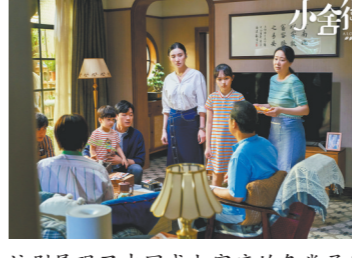
该剧展现了中国式大家庭的各类矛盾