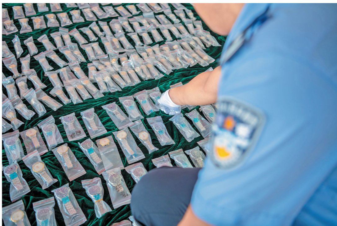
肇庆破获制售假冒国际名表案

高质量推进知识产权创造和运用。支持粤港澳大湾区重点产业做好高价值专利布局,支持关键领域自主知识产权创造和储备;扩大知识产权质押融资规模,推进知识产权证券化;充分利用港澳地区和国家高端知识产权服务资源,促进知识产权服务业走向高端化,全面助推知识产权价值实现。