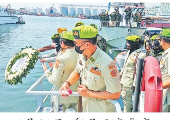
4月25日,印度新德里,当地的一处火葬场正在对新冠逝者遗体进行火化