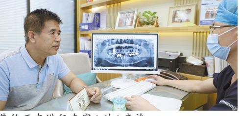
黄伯正在进行专家1对1亲诊

解决看牙难题，《广东爱牙工程社区行》福利进行中，即日起致电020-8375 2288 申领高额种牙补贴，免挂号费，专家会诊费，名额有限，火速报名！