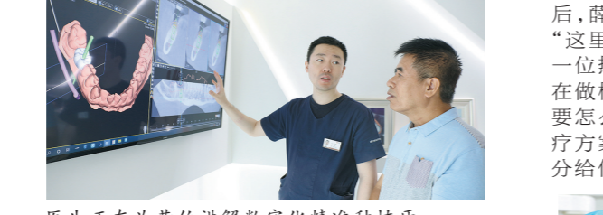
医生正在为黄伯讲解数字化精准种植牙