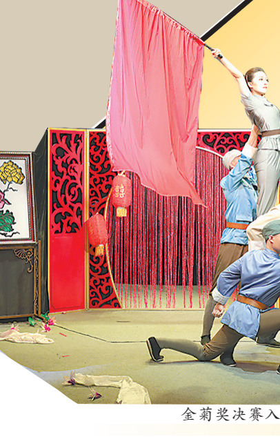
金菊奖决赛入围魔术表演《红》