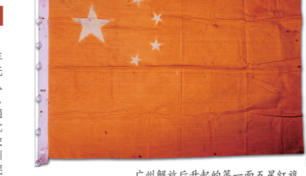
广州解放后升起的第一面五星红旗

展览现场展示的文物和图片，让观众重温了中国共产党的历史。其中，广州博物馆藏的“广州解放后升起的第一面五星红旗”这件国家一级文物弥足珍贵。