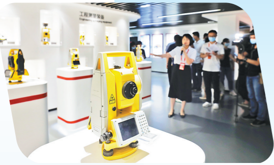
南方测绘展出的工程测绘装备