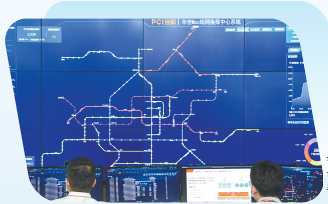
佳都科技创新应用软件

箱包皮具、珠宝首饰、食品饮料等五大产业集群,提出了建设五大行业工业互联网平台、打造百家数字化转型企业标杆、推动万家企业“上云上平台”等措施。除了形成新旧转换的产业网,广州需要构建起强大的人才网和资金网。这三张网的构建都离不开营商环境的优化和政务服务的便捷。2018年以来,广州先后实施营商环境1.0、2.0、3.0改革,从“简政放权”到“重点领域营商环境攻坚”,再到“实施跨部门革命性流程再造”,实现了营商环境改革“三级跳”,而2021年广州政府工作报告也9次提到“营商环境”一词,更提出要在今年开展营商环境4.0改革,全面推广市场轻微违法经营行