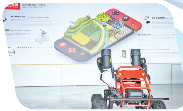
极飞科技生产的农业无人车