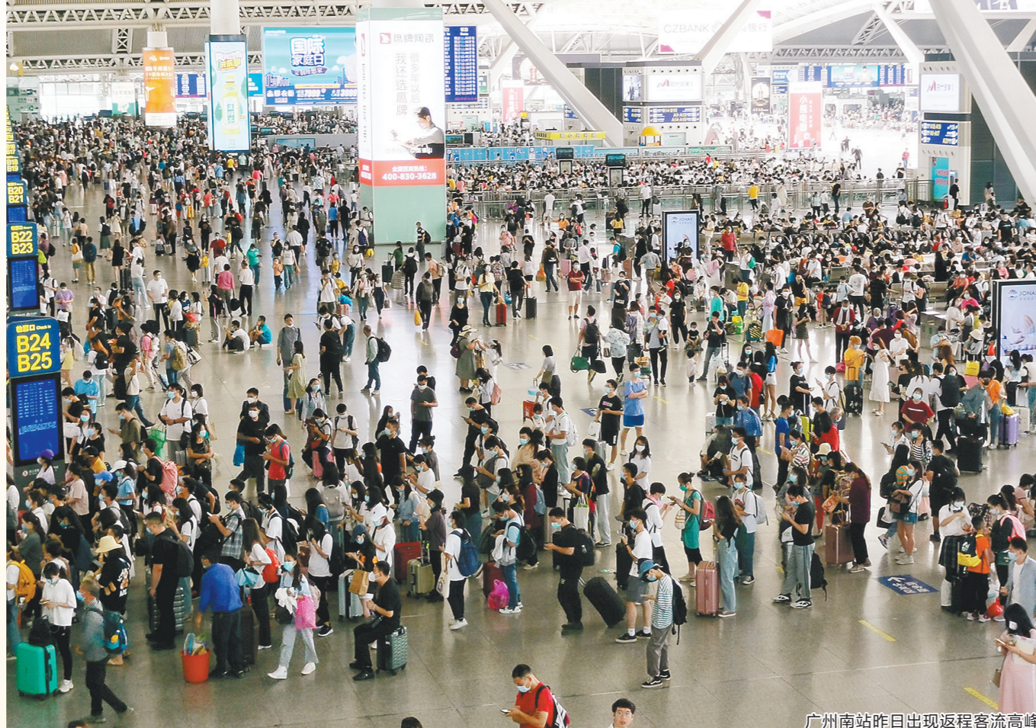
广州南站昨日出现返程客流高峰