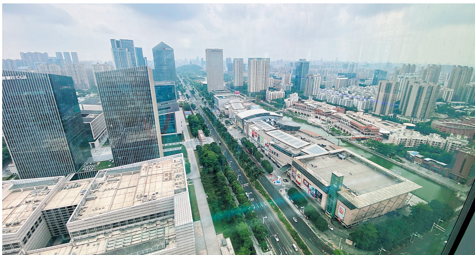
广东金融高新区