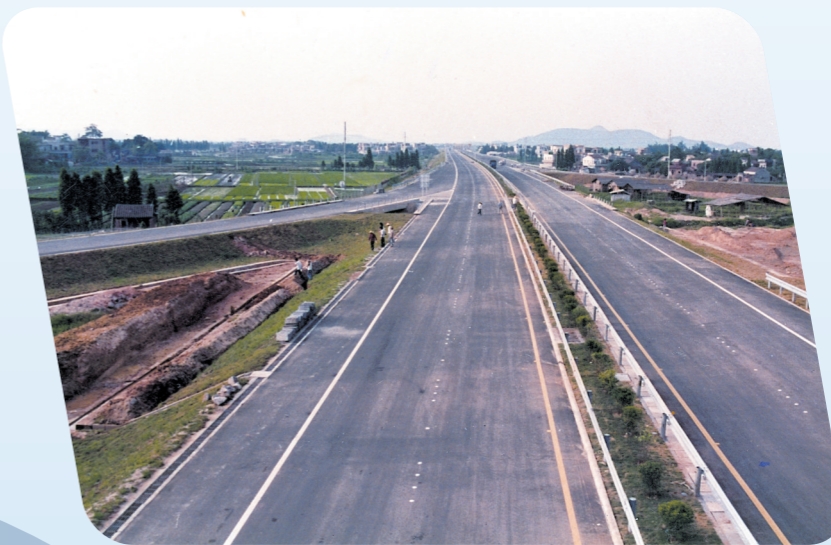
▲以前的广佛高速

速公路连接着经济命脉,为助力粤港澳大湾区“1小时生活圈”建设、构建“一核一带一区”区域发展格局、实现全面小康目标任务做出了不可估量的贡献。