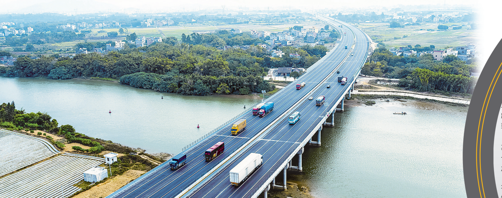
▼开阳高速双向八车道通行

●“十三五”时期,江门积极打造珠西综合交通枢纽,交通大会战取得显著成效,交通基础设施累计完成投资908.5亿元,完成计划任务的110.1%,是“十二五”(304.7亿元)的近3倍。 ●“十三五”末,全市铁路里程达到205公里,较“十二五”末年增长116%,其中高速铁路运营里程大幅增加;高速公路总里程达593公里,较“十二五”末年增长54%;农村公路实现200人以上自然村通硬化路目标。港口万吨级泊位6个,较“十二五”末增加200%。 ●面向“十四五”,江门将规划实施六大重点工程,涉及建设项目366个,其中包含储备项目97个。按照国家和省投资支持政策,铁路(高铁、城际铁路、市域郊铁路)和国道项目投资(补助)力度将有所增加,“十四五”投资争取达到2000亿元左右。 ●2020年,鹤山工业城签约落户项目24个,项目总投资103.57亿元,其中投资亿元以上项目19个、10亿元以上项目4个、20亿元以上项目2个。规模以上工业总产值165.8亿元,同比增长24.7%;规模以上工业增加值41.7亿元,同比增长20.8%。 ●仓东教育基地十多年接待数万名经高速而来的游客和研学团;古劳水乡计划投资50亿元,将打造成为最美岭南水乡和粤港澳大湾区文化生态旅游度假标杆,待项目建成后,预计每年可接待游客量达400至500万人次。