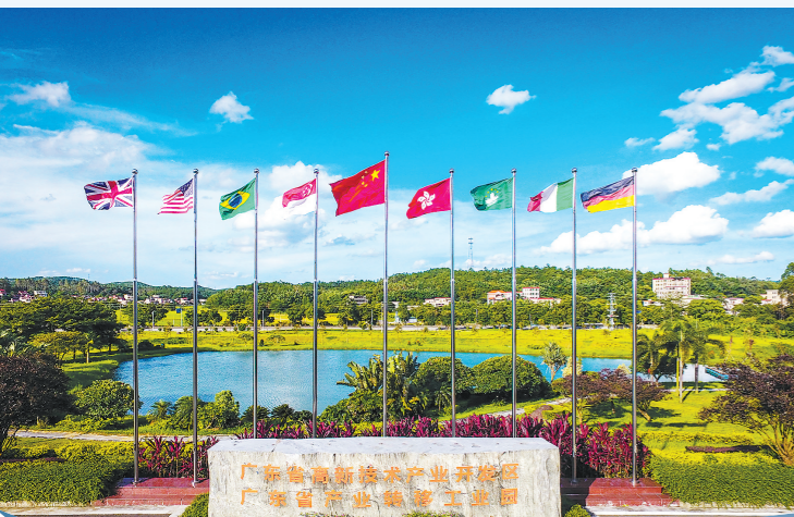
鹤山工业城

今年4月,《江门市综合交通运输体系发展“十四五”规划》(以下简称《规划》)对外公开征求意见。根据《规划》,到“十四五”末,江门市力争交通建设投资达到2000亿元,将形成“内联外通”综合立体交通网络,建成高速通达周边城市、快速联通组团和乡村、有力支撑产业平台的立体高效优质的现代化综合交通运输体系,形成“12345”的综合交通发展格局,有力支撑江门融入国内国际“双循环”新发展格局及构建“三区并进”格局,从而为经济发展释放出更大的区位优势和发展空间,助力加快打造珠江西岸新增长极和沿海经济带上的江海门户。