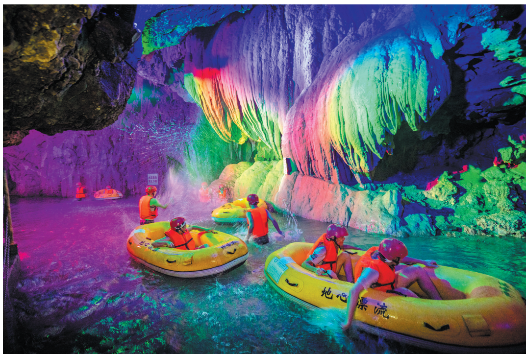
▲清远神峰关溶洞地心漂流