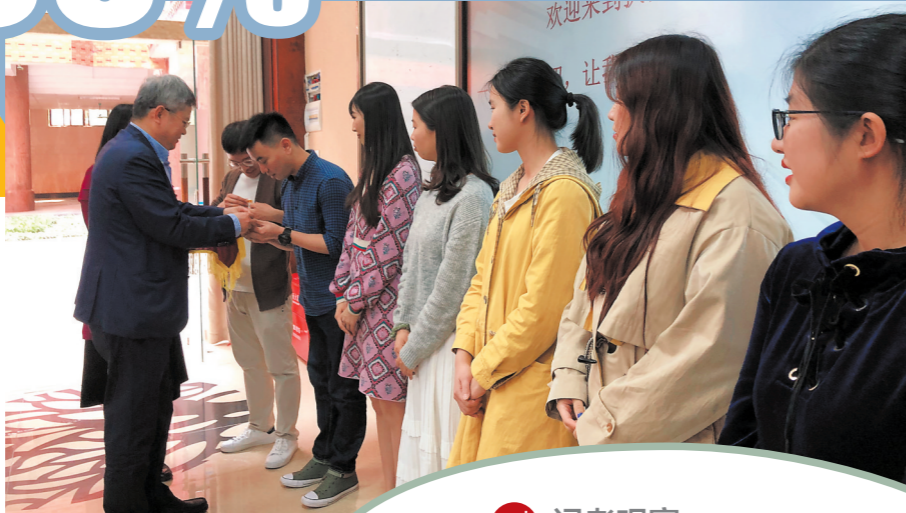
执信中学新教师培训，校长给新老师发校徽（资料图片）