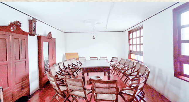
遵义会议召开时使用的长桌

1935年1月7日，中央红军占领遵义城，国民党追兵一时没有追上来。在遵义，中共中央领导层终于有了安定的环境可以认真思考、讨论中国革命和红军的未来。 1935年1月15日至17日，中共中央在遵义召开政治局扩大会议。到会的20人中，除了政治局委员和候补委员外，还有红军总部和各军团的主要负责人。考虑到当时最亟待解决的是军事路线问题，会议由早前原定召开的中央政治局会议，最后决定把一些红军主要军事指挥员扩大进来，因此变成了扩大会议。 会议开始，博古作“主报告”，周恩来作“副报告”，张闻天作“反报告”，毛泽东就长征以来的各种争论问题作长篇发言……如此一来，会场上出现了两种完全对立的思想观点和路线方针。一场严肃而深刻的真理之辩，摆到了桌