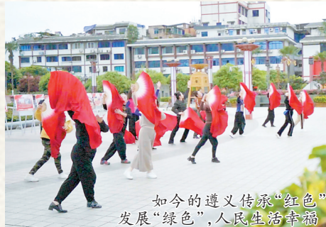
如今的遵义传承“红色”发展“绿色”，人民生活幸福

驱车到达遵义市乌江镇，记者一行登上了“五桥飞渡”观景台。站在观景台远眺，只见当年红军突破乌江战役的乌江河上，2公里范围内，5座桥梁一字排开，分别为：兰海高速乌江特大桥、川黔公路乌江双曲拱大桥、贵遵高等级公路乌江斜拉桥、川黔铁路乌江大桥、渝贵铁路乌江大桥。当地居民说：这