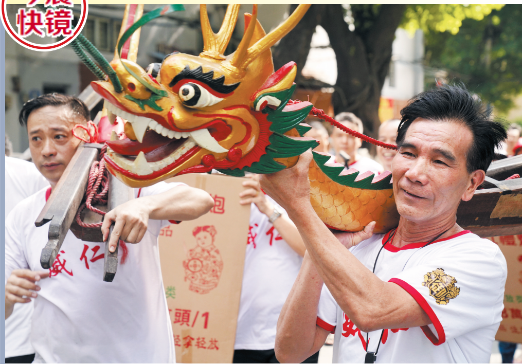
19日,荔湾湖公园内“龙船赛”进行“起龙船”仪式