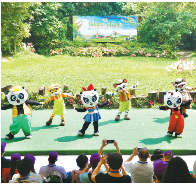
南海、番禺、顺德三地互游团,参加了启动仪式

泮塘村村民李凯帆向记者介绍,“出水”的4艘龙船分别是有400多年历史的仁威老龙、2014年新造的仁威新龙和泮塘女子龙舟,以及一艘有96年历史的龙船。龙船采用坤甸木制作、浸水坚韧更易保存,因此每年龙舟竞渡之后,人们将龙船深埋于河沙之下,再使用时需“起龙”。“今年是疫情发生后首次恢复‘起龙’传统,我真的很兴奋,我从小就跟着长辈扒龙船,承载我们悠久的历史,而且今年能恢复,说明我们国家疫情控制得好!”