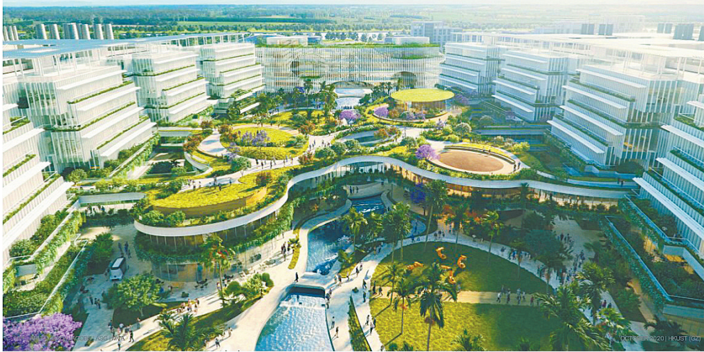
港科大(广州)校园效果图

据悉,该校2019年就开始实施提前招生的“先导计划”,前两年已招收约266位研究生,今年计划再招150人。