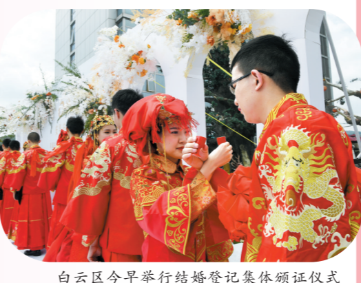
白云区今早举行结婚登记集体颁证仪式

据白云区民政局婚姻登记处主任刘青云介绍,5月20日当天,该登记处收到约250对登记预约,今天的办理量是平时的三倍多。