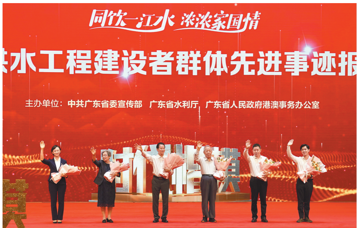
主办单位：中共广东省委宣传部 广东省水利厅 广东省人民政府港澳事务办公室

5月20日下午，“同饮一江水 浓浓家国情”——“时代楷模”东深供水工程建设者群体先进事迹报告会在广州珠岛会议堂举行。广东省直机关有关负责同志，广州市和省直、中直驻粤有关企事业单位党员干部代表，在穗高校大学生、港澳大学生代表等700多人现场聆听了报告会。报告会同时安排了网络直播。首场报告会后，报告团将赴水利部机关和广东省内有关高校巡讲。