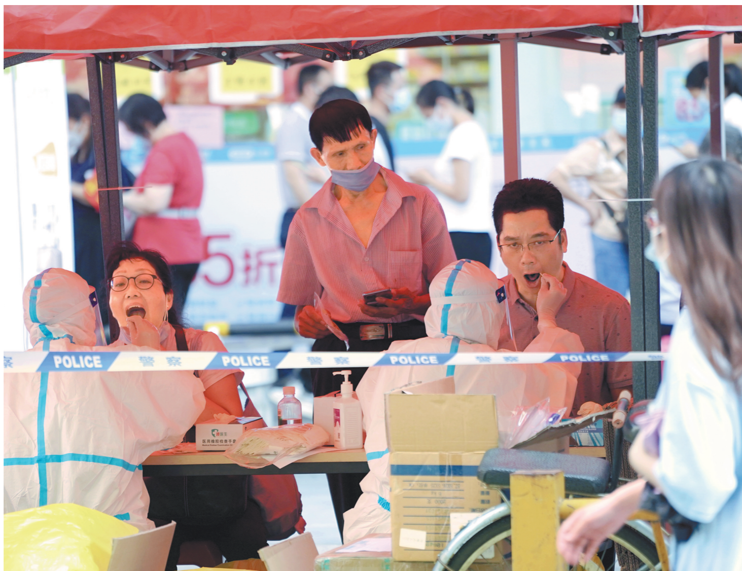
广州荔湾区锦龙社区的居民排队进行核酸检测