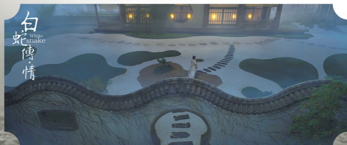
东方美学风格耳目一新