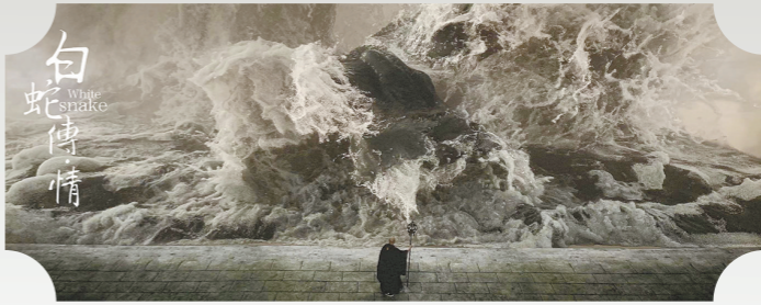
“水漫金山”一幕得到观众认可