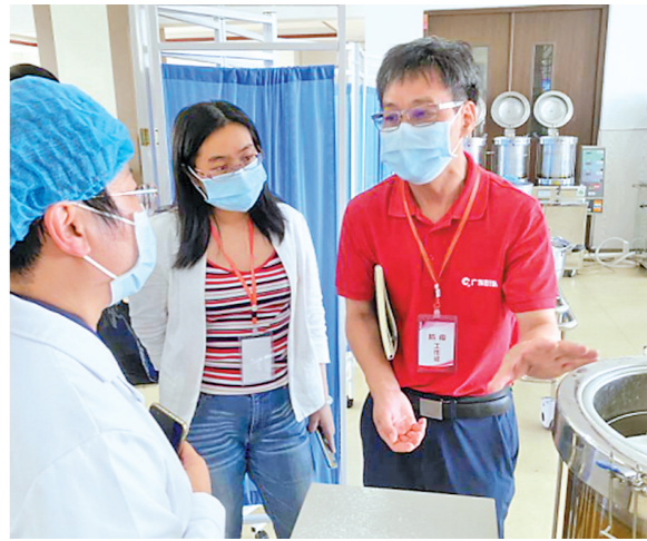
德叔指导疫情防控工作

导方案,结合当地实际情况,与当地医务人员共同开展流行病学调查和溯源,坚持中西医结合,重点发挥中医药特色优势,一人一方,一人一案,全力做好疫情防控及患者救治工作,并指导当地加强定点医院管理、院感防控、中药制剂煎煮、中药配送及质量把控等工作。 据了解,自新冠肺炎疫情发生以来,张忠德先后驰援湖北武汉、河北邢台、云南瑞丽等地开展疫情防控工作,此次圆满完成支援辽宁任务,他的战役时间达到124天。