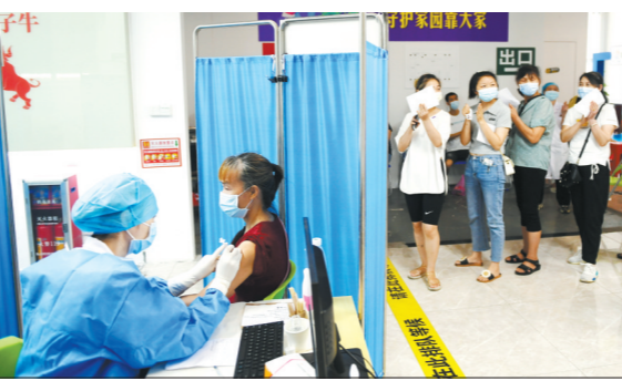
25日,海珠区某疫苗接种点,市民有序排队接种疫苗

羊城晚报讯 记者林清清、余燕红、陈辉,通讯员穗卫健宣、潘卫、白恬报道:近日广州市民对于新冠病毒疫苗接种意愿热切,疫苗接种点迎来接种人群。5月26日,广州多个疫苗接种点暂停现场派号,仅接受网络预约接种,市民需凭预约成功短信或预约二维码进场接种。 26日上午,荔湾区多宝街道社区卫生服务中心发布公告,即日暂停新冠疫苗现场派号,仅接受网上预约接种。 广州医科大学附属第三医院通告称,27日起新冠疫苗接种停止现场派号,将实行全面线上预约,医院将根据疫苗存量每天上午7时准时放号。市民可于接种当天在医院官方微信公众号预约。 26日下午,海珠区疾控官方公众号“海珠健康”发布通告称:目前,海珠区各接种点仅接受网上预约接种,暂停现场派号。市民可通过微信“穗康”小程序或“预防接种服务”APP预