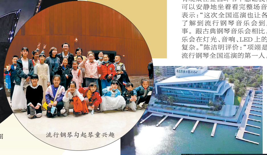
流行钢琴勾起琴童兴趣