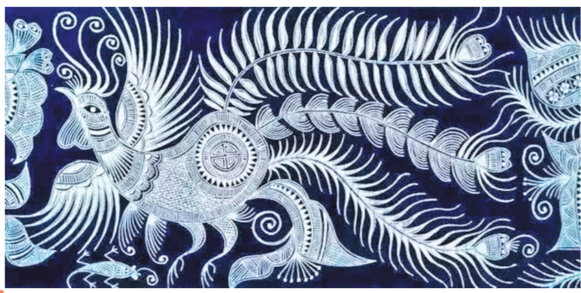
蓝染蜡染(资料图片)