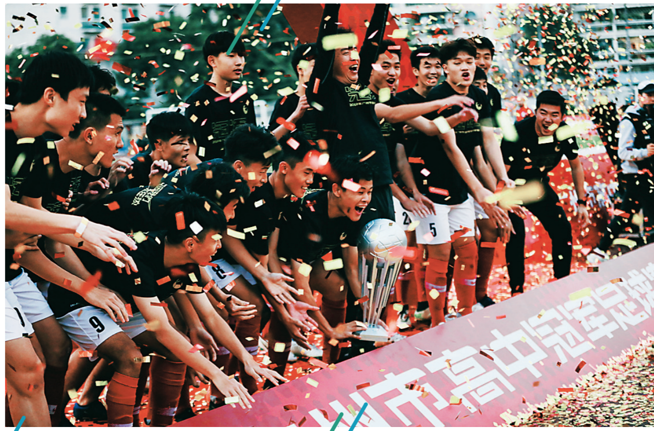
华附足球队夺得广州市高中超级杯冠军

坊间有太多华附的传说，在广州不少家长和学心中，华附总是神秘地存在着。“如今时代不一样了，虽然互联网时代信息大爆炸，但‘酒香也怕巷子深’，华附的传说很多，给人感觉很神秘，其实我们一点也不神秘。”华附党委书记、校长姚训琪在校园开放日的宣讲会上，为大家一一破解华附的各种坊间传闻。