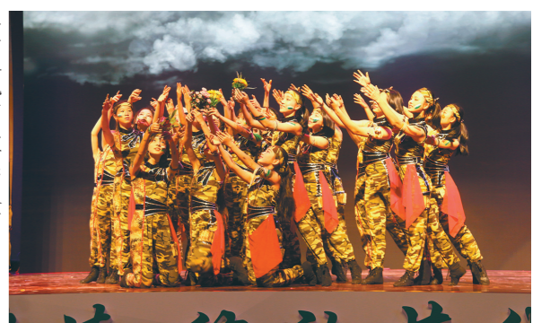
华附春晚学生舞蹈表演