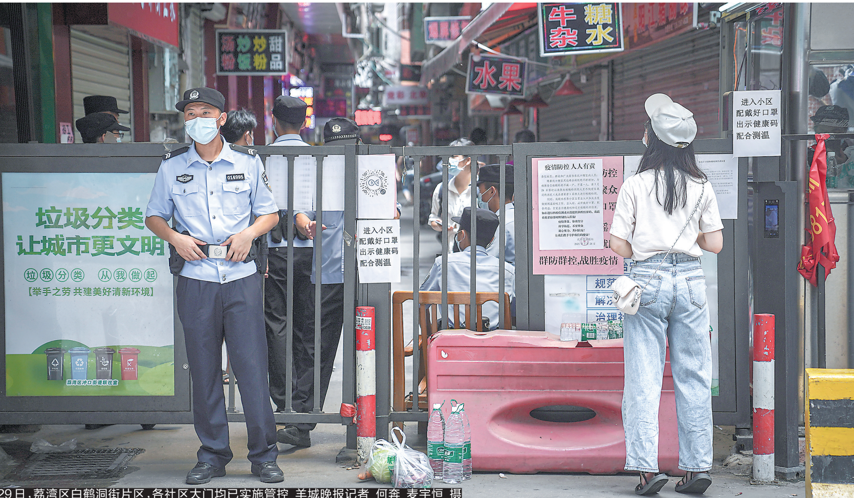
29日，荔湾区白鹤洞街片区，各社区大门均已实施管控。羊城晚报记者 何奔 麦宇恒 摄

越秀集团旗下的风行生鲜通宵达旦开展调货和备货工作。至29日早上，越秀集团共派出35人支援东漱街，在芳村花园、金昊大厦等六处设便民点供应。从29日凌晨起，15台车配送生鲜货物，安排排骨、瘦肉、五花肉、菜心、生果、番茄、土豆等二十个品种，肉类约2.5吨，蔬菜7吨，确保荔湾区市民的正常生活必需品有充足的供应。越秀集团旗下终端门店全线正常营业，加强腊味制品、熟肉制品、自热饭等产品备货。