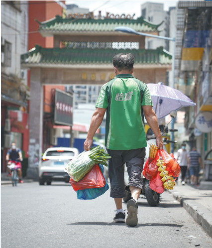
荔湾区白鹤洞街片区，不少居民加紧采购生活必需品