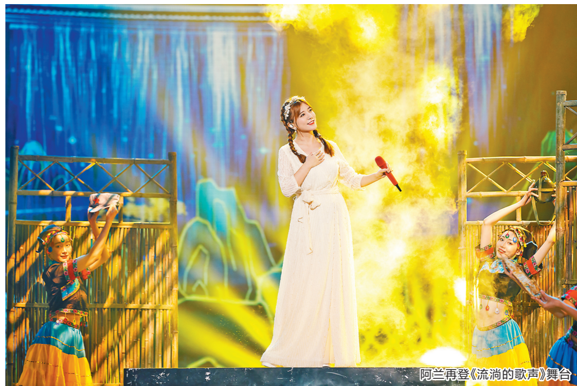
阿兰再登《流淌的歌声》舞台

阿兰:参加《乘风破浪的姐姐2》之前,我觉得自己一直都处在18岁的状态。参加节目之后,很多人开始叫我“姐姐”,我才惊觉自己原来已经是30岁以上的大人了。但我不承认这个事实,我还是个小女孩。在这一点上,我觉得岗岗姐(杨钰莹)做得超好,我就想成为她这样的女艺人,到了50岁还是那么漂亮,唱歌也好听。有的人想“乘风破浪”,我只想躺在海平面上舒舒服服、优哉游哉地过完这一生,我觉得这也没有什么错。