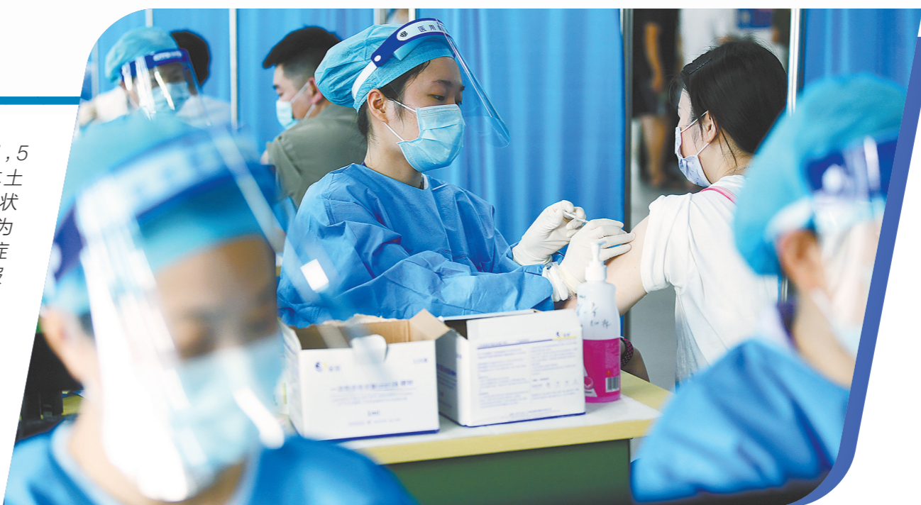
海珠区广一电商园新冠疫苗接种点,市民有序接种