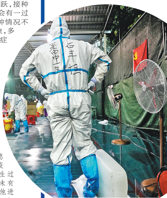
番禺洛浦公园核酸检测点,一名医务人员踩在冰块上降温

普通高中的高一、高二学生于6月1日至6月11日期间组织居家线上教学,返校时间另行通知。6月1日至高考结束,高三考生实行封闭管理。 (张闻 景瑾瑾)