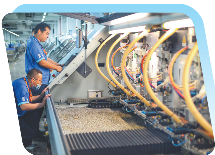
惠州胜宏科技有限公司的智工厂