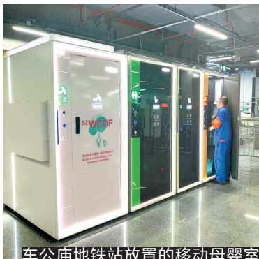
车公庙地铁站放置的移动母婴室

据悉,截至2021年5月,深圳在机场、地铁站、火车站、高铁站、商场、医院、公园等大型公共场所已建成1091间母婴室,基本实现公共场所母婴室全覆盖和一键导航。