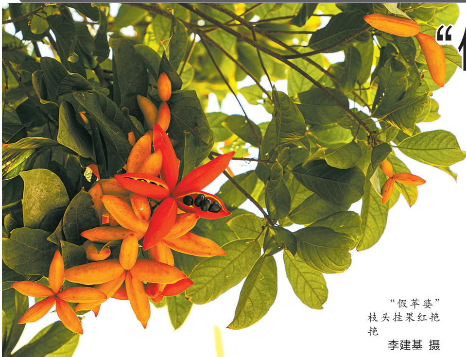
“假苹婆” 枝头挂果红艳

对于中长期天气走势,广州市气象部门6月1日分析认为,本月广州地区迎来4次暴雨过程,目前正处于本月第一次暴雨过程;预计本周五至周六有一次大到暴雨过程;6月11日至6月13日有一次大到暴雨局部大暴雨过程;6月28日至6月30日有一次大到暴雨过程。预计本月中旬前期,广州可能受台风的影响。