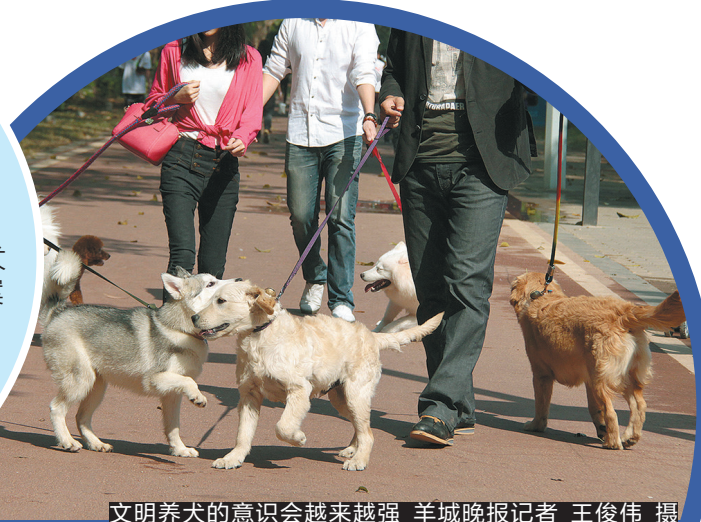
文明养犬的意识会越来越强

6月1日,《东莞市养犬管理条例》(以下简称《条例》)正式施行,不仅对犬只备案、接种狂犬病疫苗等作出了详细规定,也严禁养犬人驱使犬只伤害他人、遗弃或者虐待犬只。记者实地走访多家养犬备案服务点获悉,首日已有众多养犬人拿到了纸质备案回执,仅万江贝贝动物诊所一个上午就为9只犬只进行了登记备案。