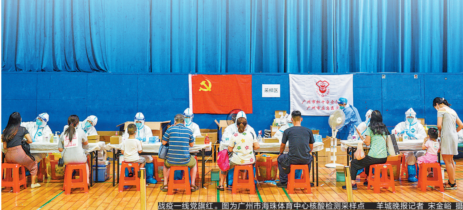
战疫一线党旗红。图为广州市海珠体育中心核酸检测采样点