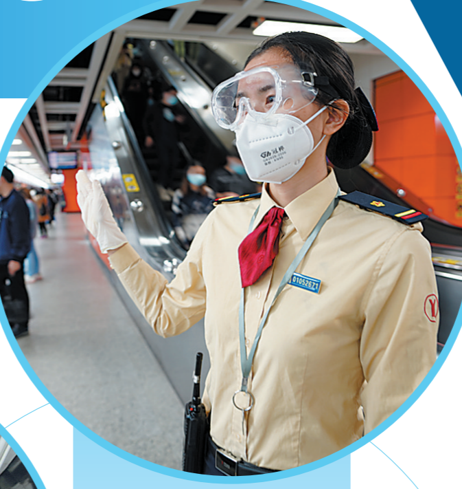
地铁站内工作人员在站台引导客流