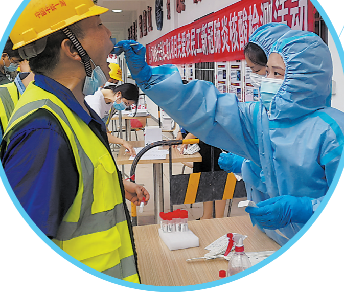
地铁工地开展核酸检测活动