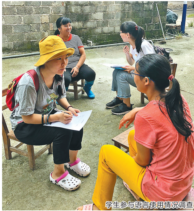
学生参与语言使用情况调查

据介绍,港科大(广州)和IDEA将聚焦人工智能、数字经济、金融科技等前沿领域开展协同创新。根据协议,双方将在人才聘用、学生培养、项目合作、科技资源共建共享等领域展开深度战略合作。