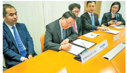
港科大(广州)(筹)校长倪明选(左二)在香港现场进行签约

羊城晚报讯 记者陈亮、通讯员卢梦舟摄影报道:6月1日,香港科技大学(广州)(筹)(下称港科大(广州))与粤港澳大湾区数字经济研究院(福田)(International Digital Economy Academy, 下称“IDEA”)战略合作框架协议签约仪式在穗、深、港三地线上、线下同步举行。