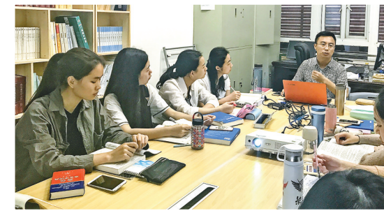
师生进行研讨交流