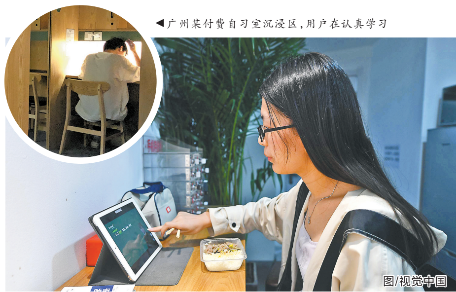
广州某付费自习室沉浸区,用户在认真学习

记者走访了多家付费自习室后发现,这些付费自习室一般分为沉浸区和阳光区,有些还设有VIP区。此外,店里还设有茶水区、休息区,前台有手机充电器、静音鼠标、消音垫等物品供借用,满足用户自习之外的需求。