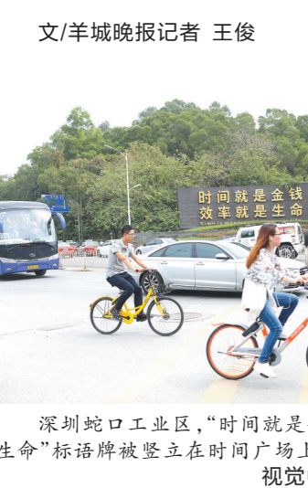
深圳蛇口工业区，“时间就是金钱，效率就是生命”标语牌被竖立的时间广场上(资料图)

1981年，袁庚提出“时间就是金钱，效率就是生命”口号。这个巨型标语牌矗立在蛇口工业区最显眼的地方，很快传遍神州大地。在蛇口工业区的开发过程中，招商局在这里开展了一系列的改革，其中的一项制度，居然因为4分钱“惊动”了中南海，它就是超产奖金制度。当时，为了提高工人的积极性，时任蛇口工业区负责人的袁庚主持制定了运泥车“每超一车奖励4分钱”的定额超产奖励制，工人的积极性得到大幅提高，工程建设迅速被提速。随后，超产奖金制度被有关部门叫停，袁庚通过一些渠道向中央反映。中央领导作出批示，超产奖金制度得以恢复。在袁庚带领下，蛇口工业区在全国率先推行了企业的管理体制、分配体制、干部人事制度、住房制度、金融改革等一系列改革试验，创下24项全国“第一”。这一系列改革及其复制推广，有效激发了企业的创