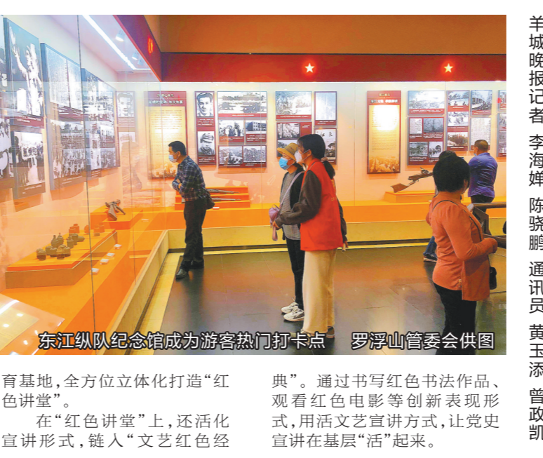
东江纵队纪念馆成为游客热门打卡点

动。现场，4名退役军人志愿者声情并茂地讲述着保家卫国的历史，分享往昔峥嵘岁月。“有些故事，不会因时间的流逝而褪色。”在场的入党积极分子纷纷表示通过此次宣讲活动，进一步学习了军人的高尚情怀、顽强斗志、英雄气概和奉献精神，加深对党史的了解。