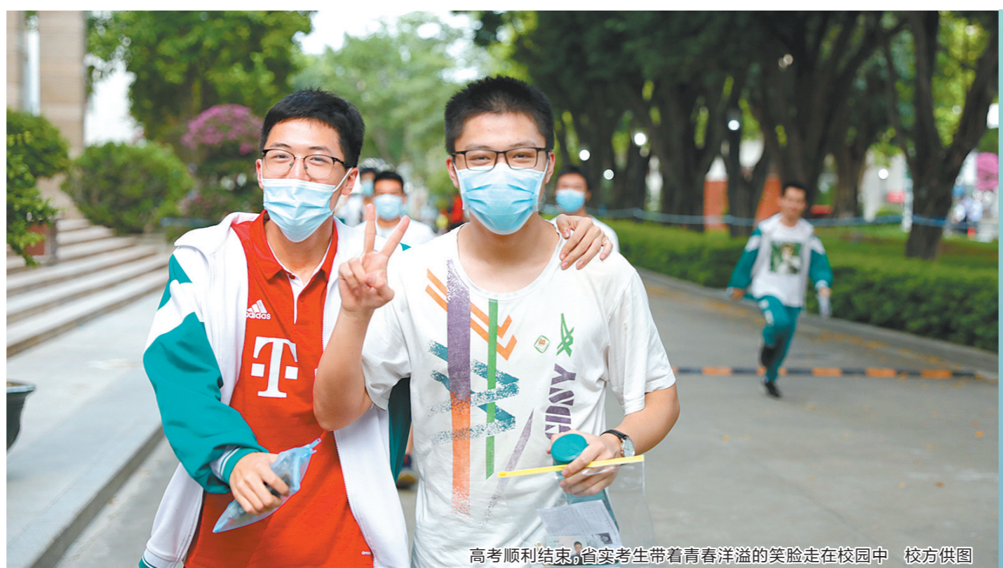
高考顺利结束,省实考生带着青春洋溢的笑脸走在校园中