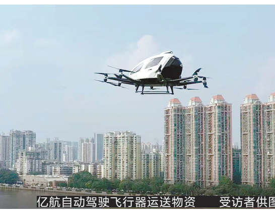
亿航自动驾驶飞行器运送物资

的行驶提供了稳定的通信保障。 鹰击长空 无人机常态化运输 科技力量不光从地面驰援,还从空中支援。广州本土智能自动驾驶飞行器科技企业亿航智能,也运用其科技产品,积极参与到抗疫工作中。