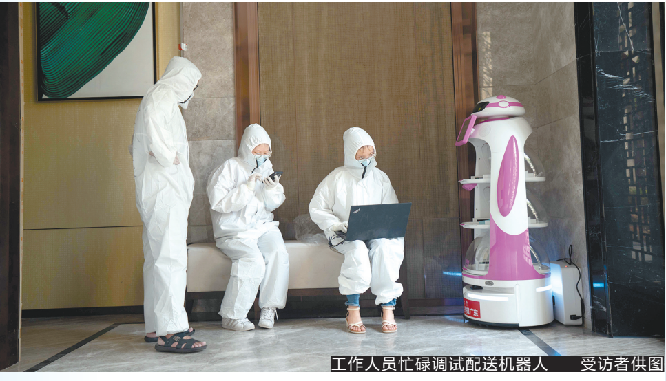
工作人员忙碌调试配送机器人

从北京赶来的还有美团战队。6月5日凌晨,美团无人配送车团队从北京出发,赶来广州抗疫一线。到达广州后,无人配送车一方面与美团买菜、美团优选结合进行疫情区域生鲜果蔬配送,另一方面配合相关部门进行物资保障运输。 另据小马智行方面介绍,截至8日下午,小马智行无人车队跨区连轴支援抗疫,共执行两百多次人员接送任务和近千次物资保障任务,物资运