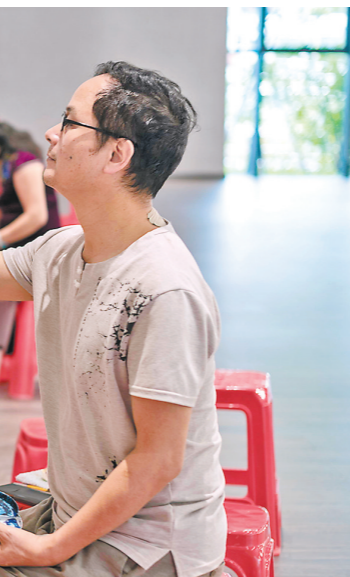
龙门农民画描绘百年党史

学习党史根本目的是为了更好服务群众。龙门县推出“我为群众办实事”“三微”行动，28名县四套班子成员、128个县直单位分别挂钩联系11个乡镇(街道、区场)、180个村(社区)，开展民生实情大走访、大排查、大化解，及时解决民忧急盼“微实事”1648件、广泛征集群众意见“微提案”56件、踊跃参与点亮困难群体“微心愿”328个，切实为民排忧解难，践行初心使命。