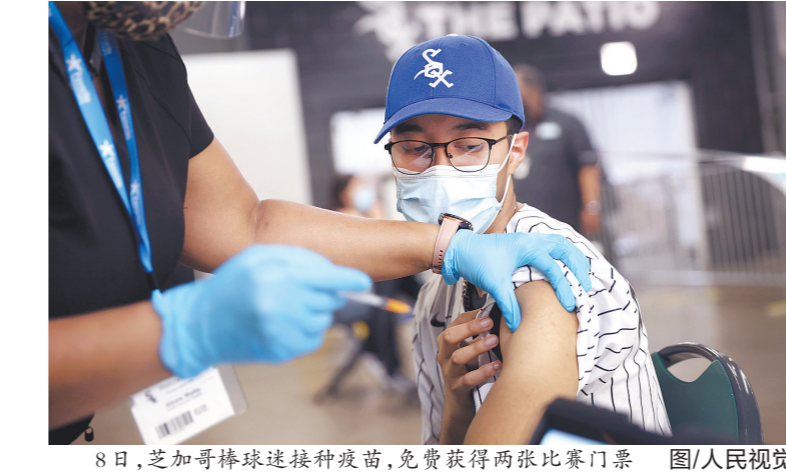
8日,芝加哥棒球迷接种疫苗,免费获得两张比赛门票

乌克兰认为,对她而言,接种疫苗不那么迫切,因为她已经感染新冠病毒。她的同学在疫苗接种推广初期争相在“照片墙”等社交媒体上传疫苗接种卡照片,如今疫苗已经供应数月,较年轻人谈论疫苗,“现在一切恢复正常了”。 激励举措花样百出 为鼓励民众接种,美国政府采取一系列激励举措,包括接种疫苗可以带薪休假、与医疗机构和社区等合作为民众接种提供便利,甚至提供巨额奖金。美联社报道,这些举措在一定程度上有助于维持民众对接种疫苗的关注。 在俄亥俄州,共和党籍州长迈克·德瓦恩5月12日宣布设立彩票鼓励民众接种疫苗。这个彩票将在数周内过期的新冠疫苗接种。而在阿肯色、俄亥俄州,也有约27万剂疫苗即将过期。 美国广播公司9日以俄亥俄州马州卫生部门官员基思·里德为消息源报道称,州卫生部门正把过期疫苗从现有库存取出,把过期疫苗从现有库存取出,正按照疾病控制和预防中心恰当处理指南操作。