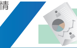
羊城晚报记者 董柳

羊城晚报记者 林清清 通讯员 查冠琳 那个没有家人迎接独自离开考场的少年,特意录制视频发给羊城晚报:“我把妈妈的话写进了作文”