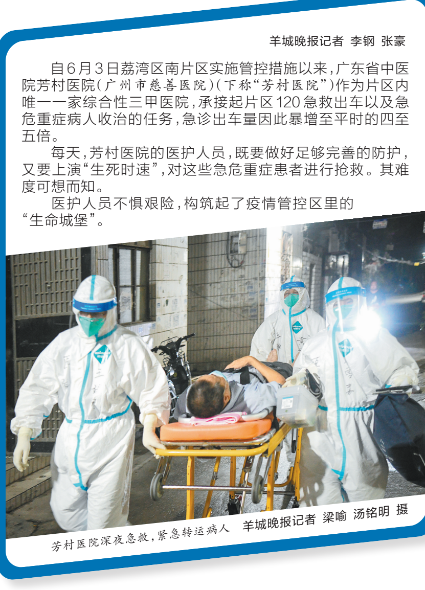
芳村医院深夜急救,紧急转运病人

紧急打通静脉通道十分钟后,这名病人就被送往相关科室进行治疗。没想到的是,还没等医护人员喘口气,又有