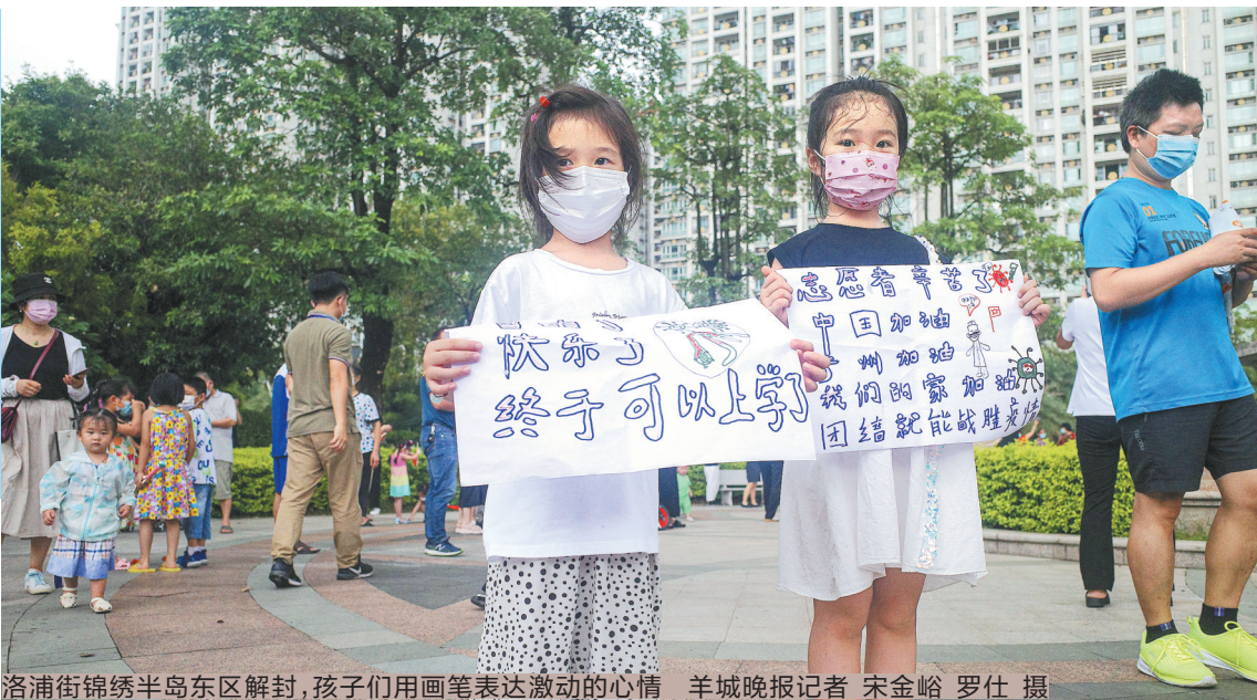
洛浦街锦绣半岛东区解封,孩子们用画笔表达激动的心情

根据上级指引,锦绣半岛东区解封后须继续落实7天防控管理。期间,东区住户必须每天通过“穗康”小程序申报个人健康状况,非东区住户(含快递员等)7天防控期内不能进入东区。