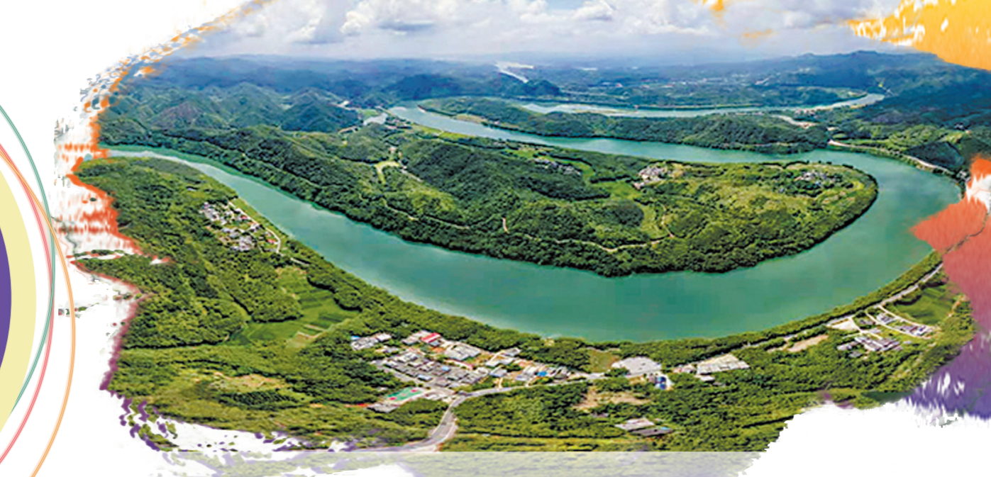
省际廊道的自然风光

在宁德时代动力及储能电池生产基地项目工地,挖掘机、桩机正在忙碌作业;小鹏汽车肇庆工厂里,一辆辆新能源汽车有序下线走向市场;城区的道路路面整洁,人居环境不断提质……肇庆,这座千年历史文化名城,正在不断奋进,迸发活力。面对“双区”建设、“双城”联动重大机遇,肇庆坚持走对走实走好高质量发展路子,坚持产业强市不动摇,聚焦“4+4”产业体系集群发展,在产业招商落地实现“破题破局”,在发展中坚持生态优先,全方位参与粤港澳大湾区建设取得新进展,“一带一廊一区”区域发展格局加快形成。