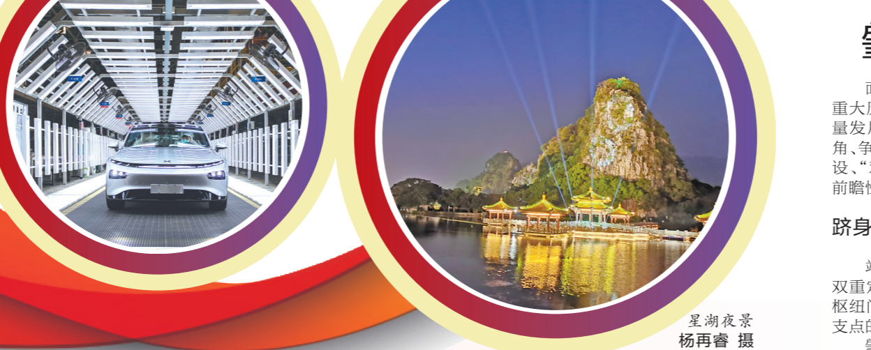
星湖夜景